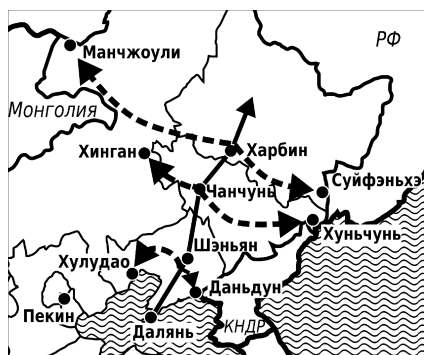
Карта № 1. Одна главная ось и четыре экономических центра

содержанием. В настоящее время в него включены три открытые индустриально-экономических пояса, за счет чего Дунбэй намерен активизировать внешнеэкономическую открытость по трем направлениям.