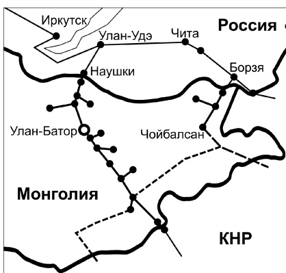
Карта № 2. Железнодорожная ветка «Две горы»

В ходе визита Си Цзиньпина в Монголию в 2014 г. было подписано соглашение о строительстве железнодорожной ветки «Две горы» (Аршань (КНР) — Чойбалсан (Монголия)). Экспертиза этой железнодорожной ветки была проведена Программой развития ООН.