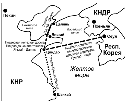
Карта № 4. Транспортные артерии Открытого индустриально-экономического пояса южной линии

Тоннель состыкуется с Восточной железной дорогой (КВЖД) и с морской переправой «Циндао—Сеул». Так старая промбаза Дунбэя объединится с экономикой Южной Кореи и Японии, на западе —