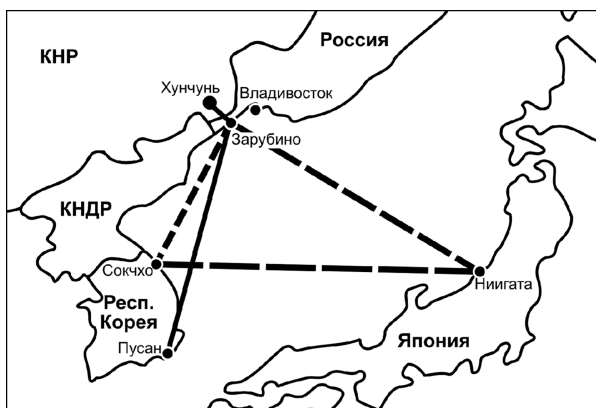
Карта № 3. Стратегия провинции Цзилинь — «выход к морю посредством аренды портов»

Экономический пояс средней линии — зона стыка границ стран СВА, представленного следующими «реперными точками»: с китайской стороны г. Хунчунь (провинции Цзилинь), приморский порт Зарубино, южнокорейские порты Сокчхо и Пусан, японский порт Ниигата