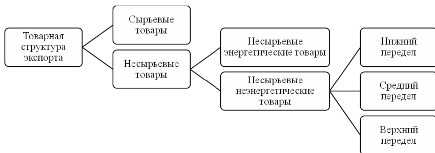
Рис. 1. Товарная структура экспорта по методике нацпроекта МКиЭ

следний классифицируется по степени передела и включает три категории: нижний, средний и верхний.